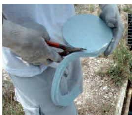
Découper et positionner le panneau préfabriqué