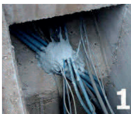
Etaler du mastic sur et entre les câbles