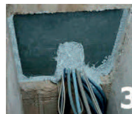
Sceller le panneau à l'aide du mastic. Ebavurer pour obtenir une belle finition.